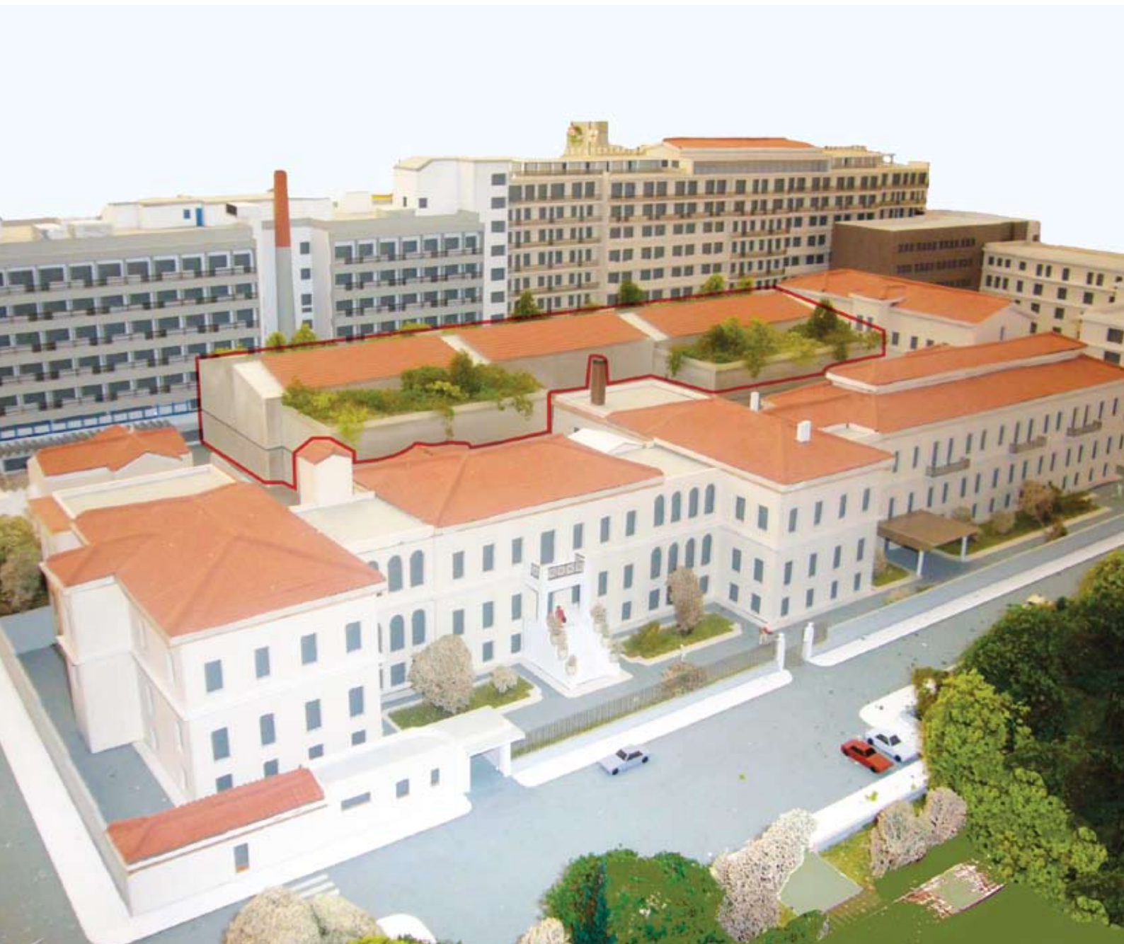
Π.Γ.Ν. «Ο ΕΥΑΓΓΕΛΙΣΜΟΣ», τελική μακέτα