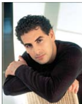
JUAN DIEGO FLOREZ

Wherever I sing, I always try to be close to those that have great needs. As a person I am very sensitive, and through my voice and music I try to offer as much as I can to those who suffer, to give them light, joy and most of all hope. For this reason I am especially happy because for my first performance in Greece, I am singing in such an impressive and historical place for the needs of the THORAX Foundation, and to be more precise for the construction of the new wing and the new intensive care units for the Evangelismos Hospital.