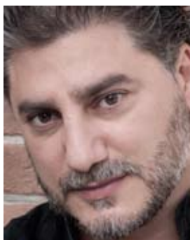
JOSÉ CURA ΤΕΝΟΡΟΣ

« N ous υγιής εν σώματι υγιεί». Η διάσημη αυτή ρήση δεν αφορά μόνο το σώμα ενός ανθρώπου αλλά τα σώματα όλων, «το παγκόσμιο σώμα της ανθρωπότητας». Με αυτή τη σκέψη προθυμοποιήθηκα να συμβάλω στο σκοπό του Ιδρύματος ΘΩΡΑΞ, την ανέγερση της νέας πτέρυγας Εντατικής Θεραπείας του Νοσοκομείου Ευαγγελισμός.