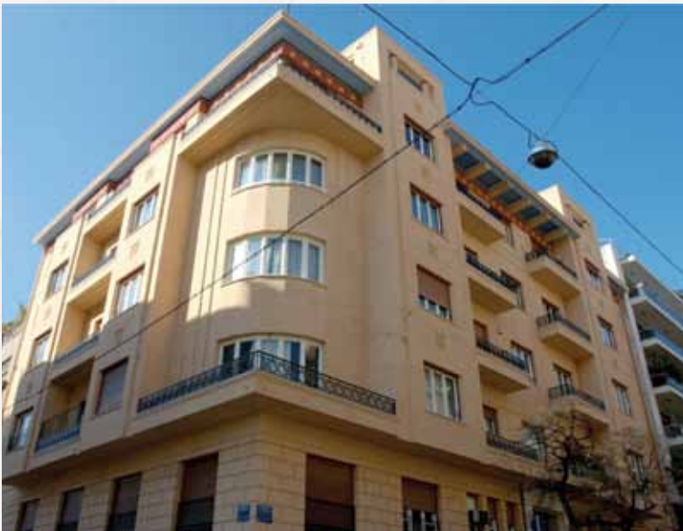
ΠΡΟΣΩΠΗ ΚΤΙΡΙΟΥ ΠΛΟΥΤΑΡΧΟΥ 3