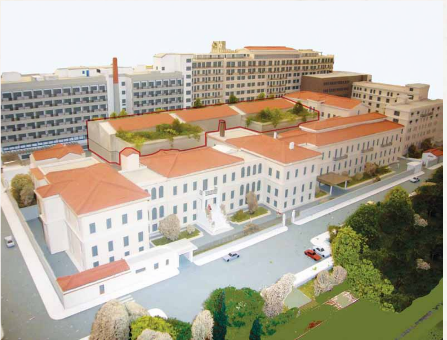
Π.Γ.Ν. «Ο ΕΥΑΓΓΕΛΙΣΜΟΣ», ΤΕΛΙΚΗ ΜΑΚΕΤΑ