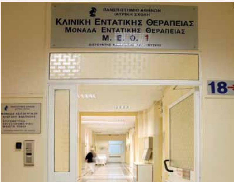
ΜΕΘ ΝΟΣΟΚΟΜΕΙΟ «ΕΥΑΓΓΕΛΙΣΜΟΣ»