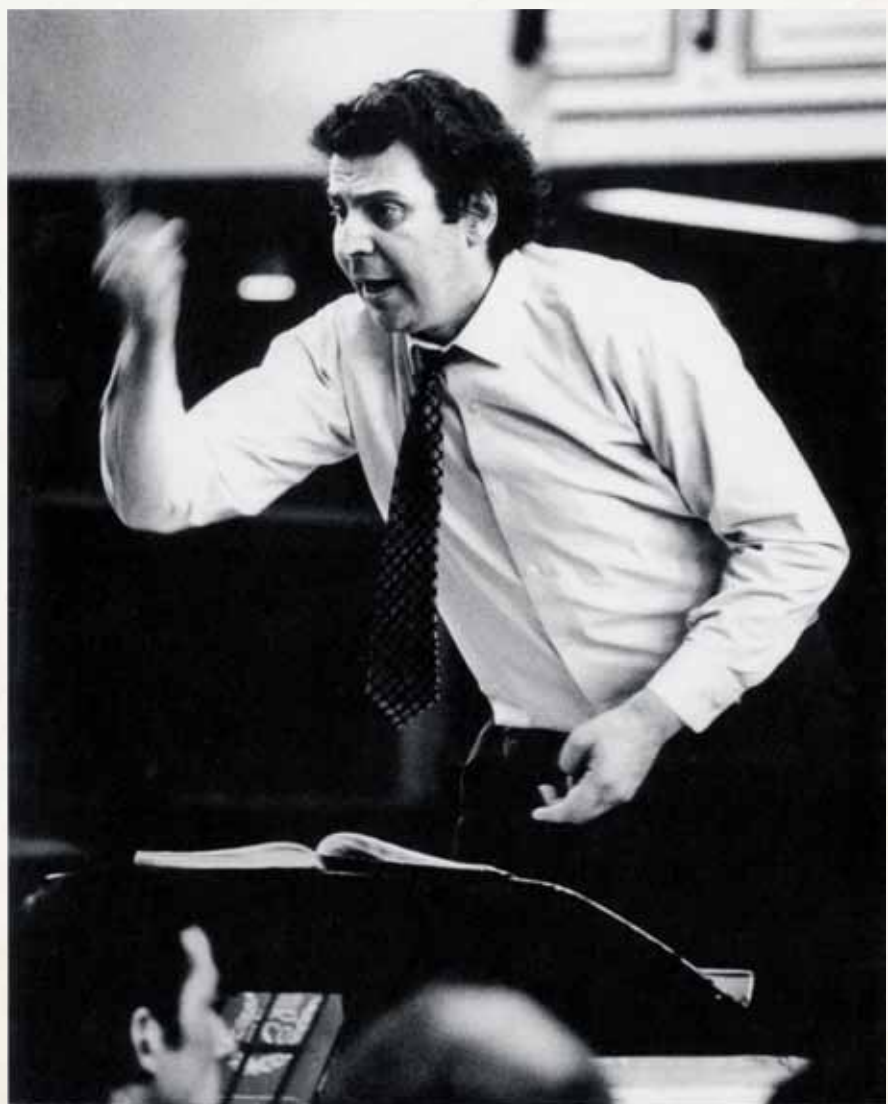
Μίκης Θεοδωράκης – Μαρία Φαραντούρη Πνευματικό Εμβατήριο 1970, Λονδίνο, Royal Albert Hall Πρώτη εκτέλεση και ηχογράφηση του έργου