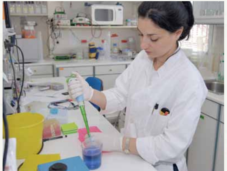
ΕΡΓΑΣΤΗΡΙΟ Γ.Π. ΛΙΒΑΝΟΣ