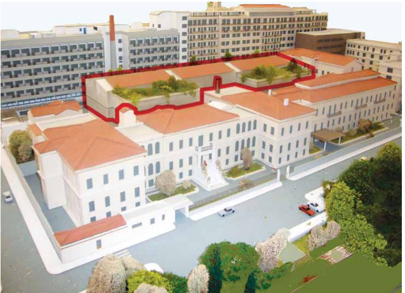
Π.Γ.Ν. «Ο ΕΥΑΓΓΕΛΙΣΜΟΣ», ΤΕΛΙΚΗ ΜΑΚΕΤΑ