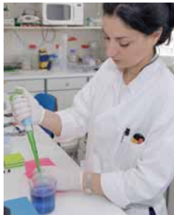
ΕΡΓΑΣΤΗΡΙΟ «Γ.Π. ΛΙΒΑΝΟΣ»