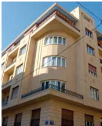
ΠΡΟΣΩΠΗ ΚΤΙΡΙΟΥ, ΠΛΟΥΤΑΡΧΟΥ 3