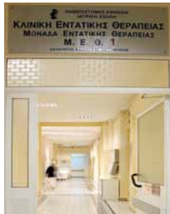
Μ.Ε.Θ. ΝΟΣΟΚΟΜΕΙΟΥ «Ο ΕΥΑΓΓΕΛΙΣΜΟΣ»